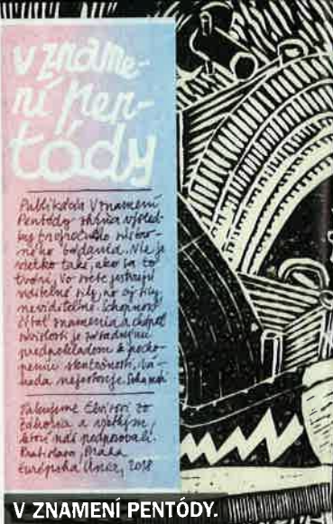
V ZNAMENÍ PENTÓDY.