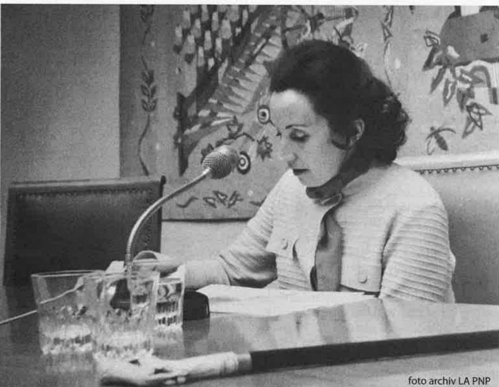
Bohumila Grögerová při autorském čtení v německém Hofu (1968)